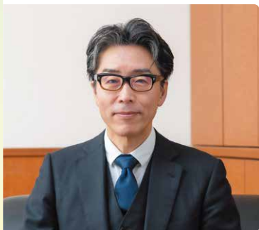
暁中学校・高等学校 校長

3年間を振り返れば、皆さんとこの暁高校で共に過ごした時間は、校長として至福の時でありました。卒業に際して、新しいステージでの皆さんのご活躍を、学校長として心より祈念しています。