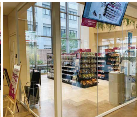
吹抜け天井とガラス壁のある明るく広々とした店舗

オープンに伴い、両大学の教育後援会様から「業務用電子レンジ」「貯湯式湯沸かし器」「食べ残し回収ボックス」をご寄贈いただきました。これにより、利便性の高い環境を学生の皆さんに提供することができています。